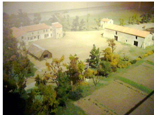
Le Parc naturel régional de Camargue (09/10/08, Arles)