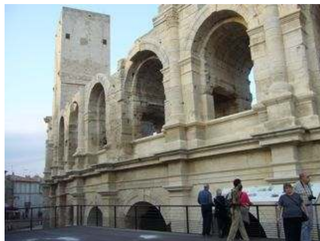
Amphithéâtre d'Arles (utilisé aussi comme arène) en manutention (09/10/09 Arles).